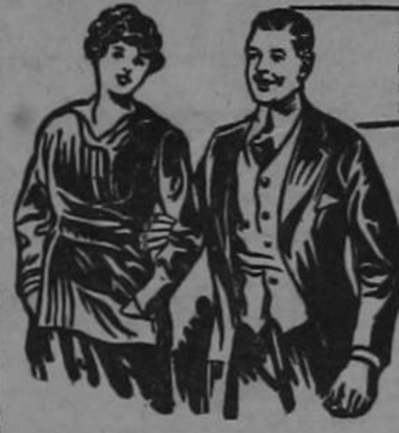
Abundancia de robustos suele ser el don de la juventud. Pero la época vigorosa se prolonga según se mantenga la sangre sana y vigorosa, rica en hierro que es el gran elemento regenerante.

Ambos están al alcance de todo aquel que quiere aprovecharse del más reciente descubrimiento de la Ciencia, el « HIERRO NUXADO » que proporciona el elemento que da a la sangre Vigor y Colorido.