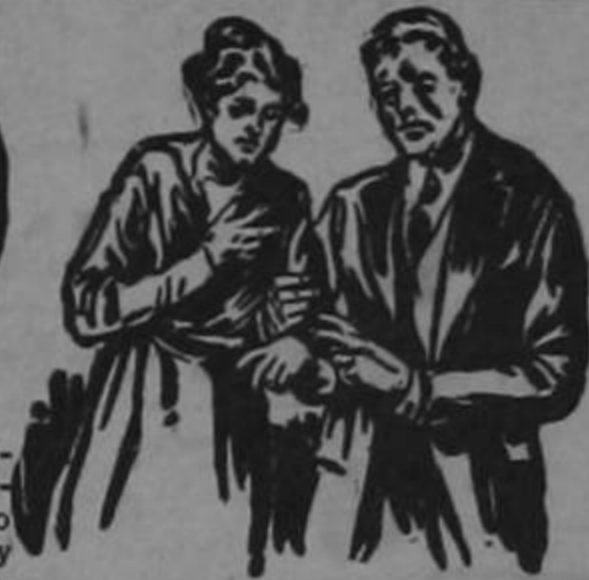
Decadencia Prematura no es tanto cuestión de edad como de la condición de la sangre, en que carece de hierro, que es el elemento esencial que la mantiene rica y vigorosa.

La fuerza, el vigor, la vitalidad y la abundante salud dependen del estado de la sangre. El grado con que se gozan estos dones depende de como la sangre lleve el oxígeno vivificante a cada órgano, tejido, fibra y célula del cuerpo y cerebro en la proporción que estos órganos requieren. Si la cantidad es suficiente da por resultado un hombre fuerte, sano y vigoroso, o una mujer hermosa con la atracción y magnetismo de la salud. Si es deficiente, el resultado natural será la debilidad, el agotamiento o constantes enfermedades y la inhabilidad para disfrutar de los gooces de la vida a que todos tenemos derecho. El hierro es el medio para llevar a la circulación el vitalizante oxígeno y falta de hierro en cantidad suficiente es la causa productora del debilitamiento y de las enfermedades.